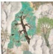
Titelbild der Ausgabe

Du Jie Gathering Birds in Autumn Forest Tinte und Farbe auf Papier 66 x 66 cm